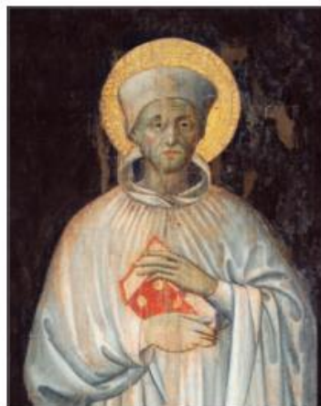
SANT' ALBERTINO DA MONTONE - PRIORE DI FONTE AVELLANA ( † 1294 )

TIMBRO: MONASTERO SANTA CROCE IN FONTE AVELLANA